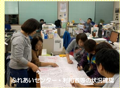
ふれあいセンター・利用者等の状況確認

10月12日(土)～13日(日)にかけて町内に最も接近した台風19号では、富士見町初となる避難勧告が一部地域で発令されました。それに伴い、第1次・第2次避難所が各公共施設で開設され、社協でも「ふれあいセンターふじみ」と「清泉荘」の2施設に福祉避難所を開設し、避難者の受入れを行いました。また、地域福祉係がある「旧落合小学校」にも第2次避難所が開設されたため、同系の職員が町役場職員とともに対応にあたりました。