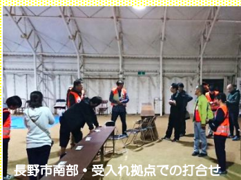
長野市南部・受入れ拠点での打合せ

被害状況が徐々に見えはじめた、10月16日(水)～17日(木)に長野市南部へ、16日(水)～18日(金)に佐久市へ、それぞれ2名の職員を派遣しました。