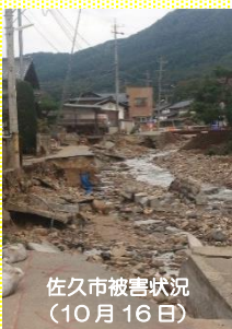
佐久市被害状況 (10月16日)

長野県内では、千曲川の決壊などにより複数の市町村が被災しました。被災された市町村では、地元社協を中心に「災害ボランティアセンター」が設置され、被災者支援にあたっています。県内広域にわたる被害のため、長野県社協より、災害ボランティアセンターの準備・運営に必要な人員派遣の要請などがあり、富士見町社協から、10月中旬から11月末にかけ、県内3拠点にのべ46名の職員を派遣しました。