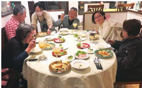
▼「ペンション RYOZO」にて夕食