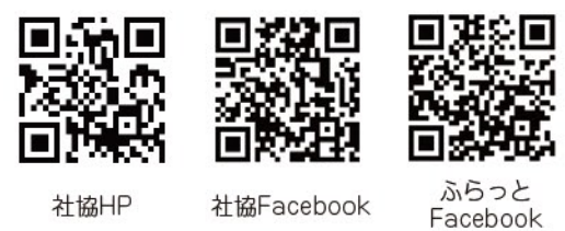
社協HP 社協Facebook ふらっとFacebook

【編集・発行】社会福祉法人 富士見町社会福祉協議会 TEL: 0266-62-6766 担当: 高木・千葉 FAX: 0266-62-6772 http://fujimi-shakyo.jp/ fureai-s@fujimi-shakyo.jp 〒399-0211 長野県諏訪郡富士見町富士見 8988-1 【デザイン・印刷】 Macchiato Design